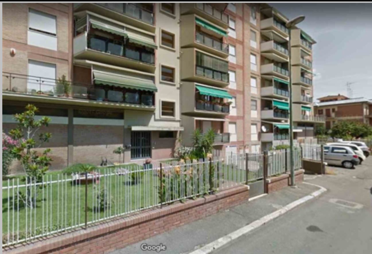
PIANO PRIMO RIALZATO